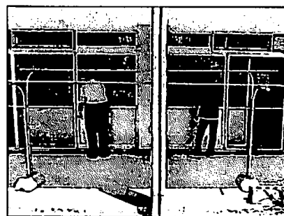
障がい者施設でのボランティア

また、毎月の華道教室の成果として、池坊舞鶴支部100周年記念誌に聖母の生徒の学びをしっかりと記録していただいたことも、励みになりました。生徒たちが人と交わり、人と共に学ぶ力をつけるために、基礎学習はもとより、体験学習・労作学習などを組み込み、充実した6月にしたいと考えています。よろしくお願いいたします。