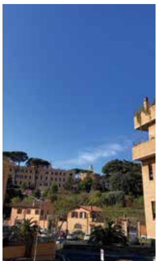
コロナのおかげで、部屋からの眺めをゆっくり見る余裕をもらえました。

・一番の恵みは、「自分のこだわり縛られない」ことに気づいたことです。先ほども書きましたが、本業は学生ですから「学校での授業」を何よりも最優先してきました。でも、それすら「何よりも大切なこと」ではなかったのです。1週間授業に行かなくても（通学して授業を受けなくても）、何とかなったのです。それにしがみついていると、他の選択肢が見えなくなりますが、なくなってみても何とかなったのです。だからこそ逆に、そぎ落としていったときに残るものが何か、探してみる機会になりました。