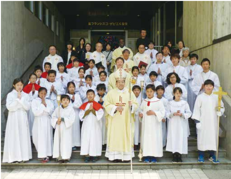
2017年 召命祈願ミサ(侍者合宿最終日) カトリック河原町教会(3月29日)

リーダーとしてはまだまだで、貢献できたことは少なく、反省点も多くありますが、リーダーとして、子どもたちと三日間過ごすことができて、良かったです。今回の経験を大事にし、もしまた機会があればリーダーをしてみたいです。