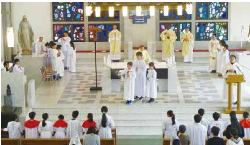
2017年 召命祈願ミサ(侍者合宿最終日) カトリック河原町教会(3月29日)

「侍者の心得」を学んだあと、行列の練習をします。永遠の祭司イエス・キリストの似姿である司祭と、共に歩むのが行列です。イエスの心を探し求めていくと、ミサに参加している一人ひとりの祈りを受け止めたいと、イエスは願っておられるのだと想像できます。侍者はイエスに奉仕する者です。イエスと心を合わせて、集まっ