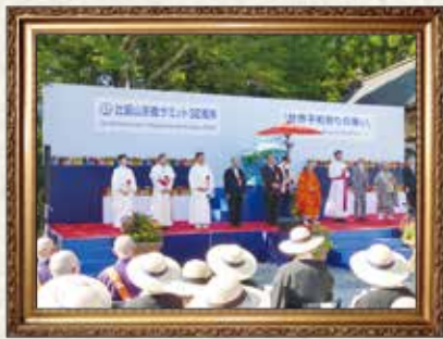
8月4日 比叡山宗教サミット 「世界平和祈りの集い」