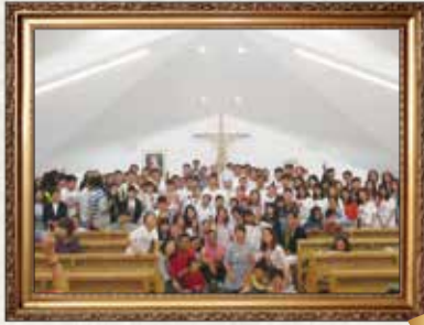
5月19日 教区青年の集い (鈴鹿教会)