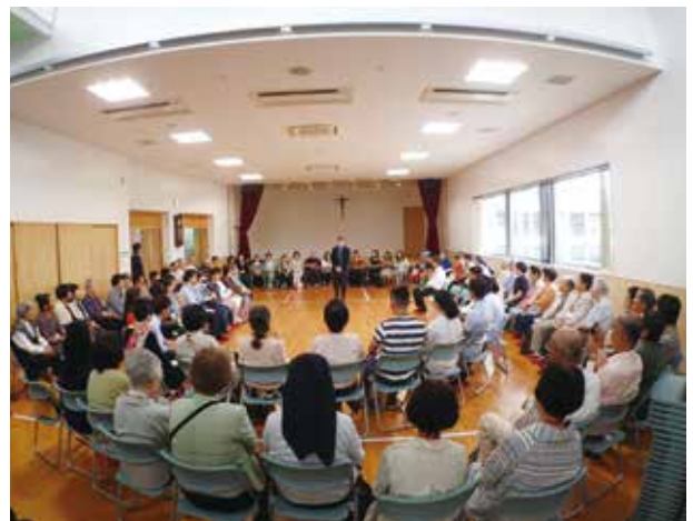
京都北部ブロック 国際ファミリーデー

教区ヴィジョン「社会と共に歩む教会」、第一回ナイス「社会に開かれた教会」、第二回ナイス「対話する教会」。京都教区は、いつもこの路線を歩み、第一回ナイス開催を引き受けられた田中司教、そして大塚司教の司教書は常にこの歩みを続けました。教区時報も、この線に沿って編集されて来たので、2019年司教書(年頭書簡)は、「教