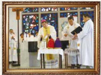
4月17日 京都教区 聖香油ミサ