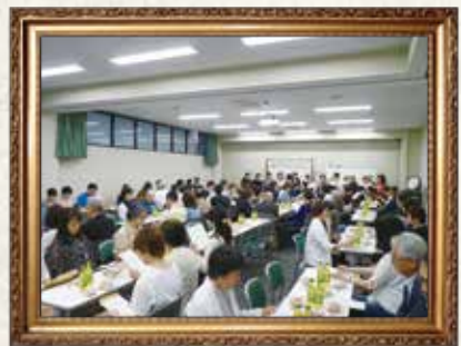
5月12日 京都教区 新信者のミサと集い