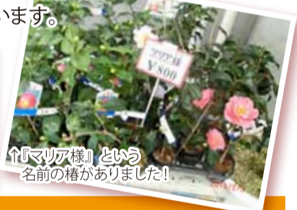
↑「マリア様」という名前の椿がありました!