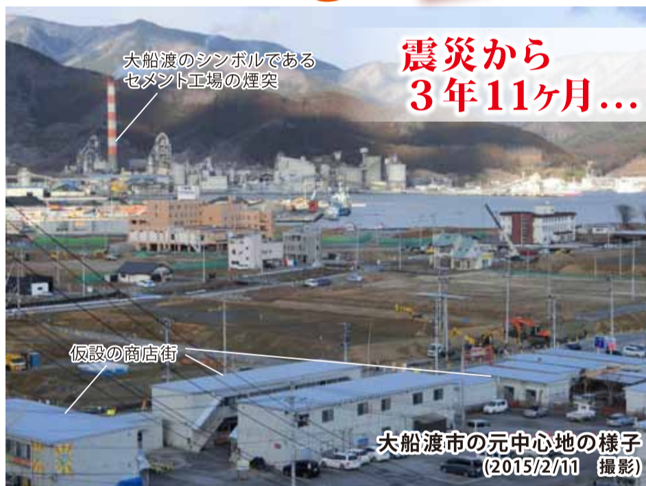
大船渡のシンボルであるセメント工場の煙突