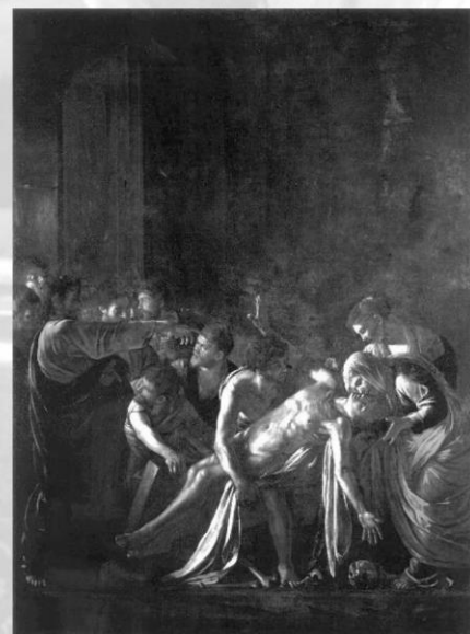
《ラザロの蘇生》1609年 メッシーナ州立美術館