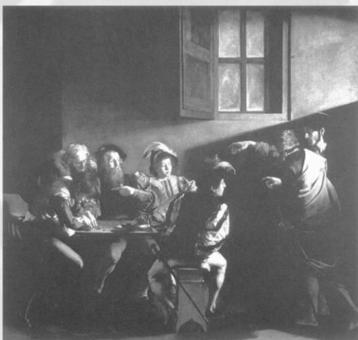
《聖マタイの召命》1600年 ローマ、サン・ルイーージ・デイ・フランチェージ聖堂