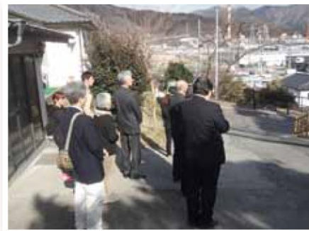
▲大船渡教会の外から黙祷を捧げる方々の様子。

同日、リアスホールで行われた大船渡市の追悼式典に参列してきました。昨年より人数は減りましたが、500名以上の方々が参列しました。