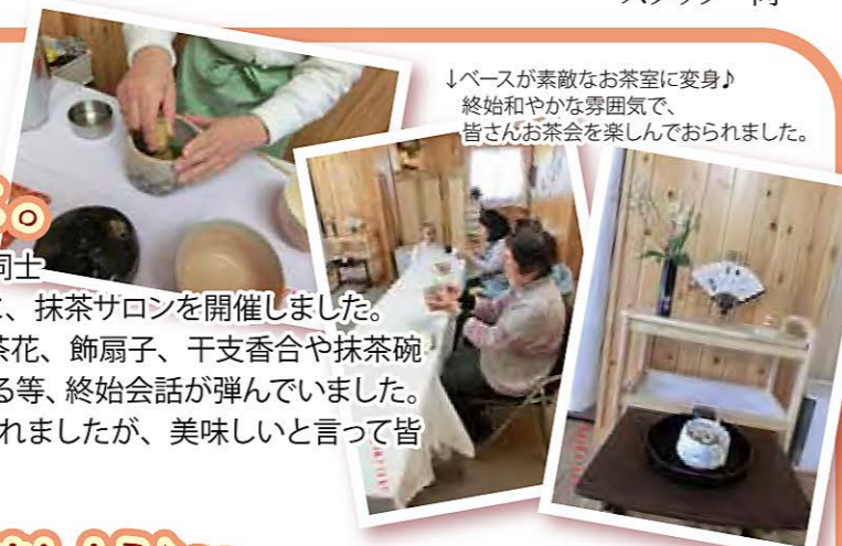
↓ベースが素敵なお茶室に変身♪ 終始和やかな雰囲気、 皆さんお茶会を楽しんでおられました。

初回にも関わらず、11名の方々がお越し下さり、茶花、飾扇子、干支香合や抹茶碗を廻し拝見をして、客人の茶道教授の方に質問をされる等、終始会話が弾んでいました。あるご夫婦は、初めての体験の緊張の中で一服召されましたが、美味しいと言って皆の会話に入り楽しんでおられました。