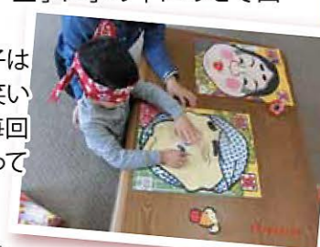
スタッフの作品です。 他にもたくさん書きました!