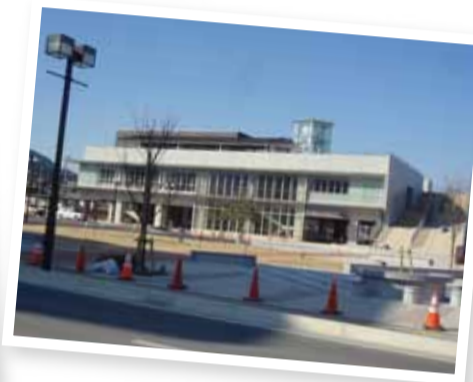
○写真 右：大船渡市防災観光交流センター 左：かもめテラス(三陸菓匠さいとう総本店)