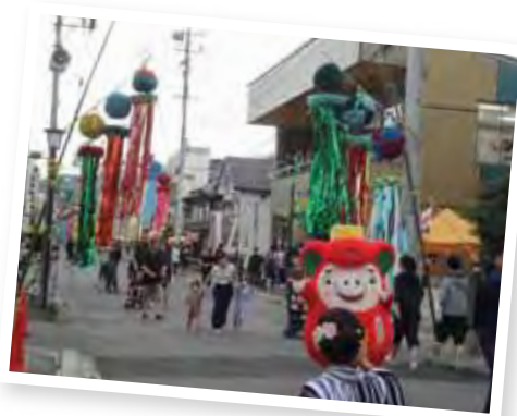
▲盛町灯ろう七夕の様子 おおふなと椿音頭ノリノリです♪

6日、7日には『盛町灯ろう七夕』が開催され、七夕山車運行や道中踊り、保育園児による引き七夕が行なわれました。夕方には七夕山車が駅前に集結し、夜の街に幻想的な光景が広がりました。カリタスベースのスタッフも、交通規制のボランティアとしてまつりの盛り上げに一役買いました。東北の短い夏をみんなで共に楽しんでいました。